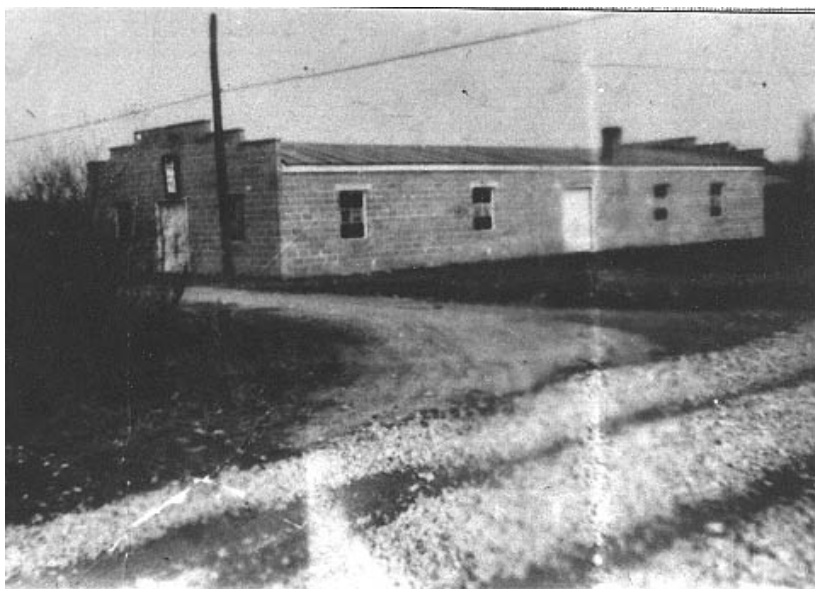
El Tabernáculo Branham recién construido.