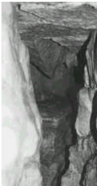
Pasillo hacia el interior de la cueva. Al fondo se aprecia la pirámide invertida y la “mesa.”

Aquel miércoles por la mañana— 8 de Mayo de 1946— William Branham se fue a su casa un hombre nuevo.