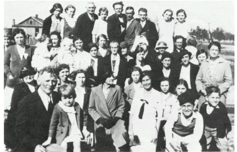
Parte de la congregación que asistió al evento.