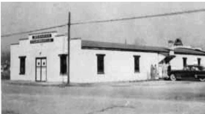
El Tabernáculo Branham en los años 40's