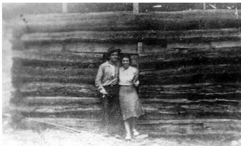
Bill y Meda

Antes 25 de Abril los Rusos no solo habían cercado Berlín, sino que también se habían encontrado con las fuerzas Norteamericanas en el río Elba a 45 millas [72.45 kilómetros] hacia el occidente. Al mismo tiempo, las defensas Alemanas en Italia se colapsaron, permitiendo a los Aliados de Occidente avanzar rápidamente hacia el norte de la bota Italiana. El 28 de Abril el dictador Italiano Benito Mussolini fue capturado y ejecutado por su propio pueblo mientras intentaba escapar del avance de los Aliados. El Fascismo ahora yacía muerto como una fuerza política mundial, y el Nazismo estaba dando sus últimos respiros. El Comunismo, por otra parte, estaba