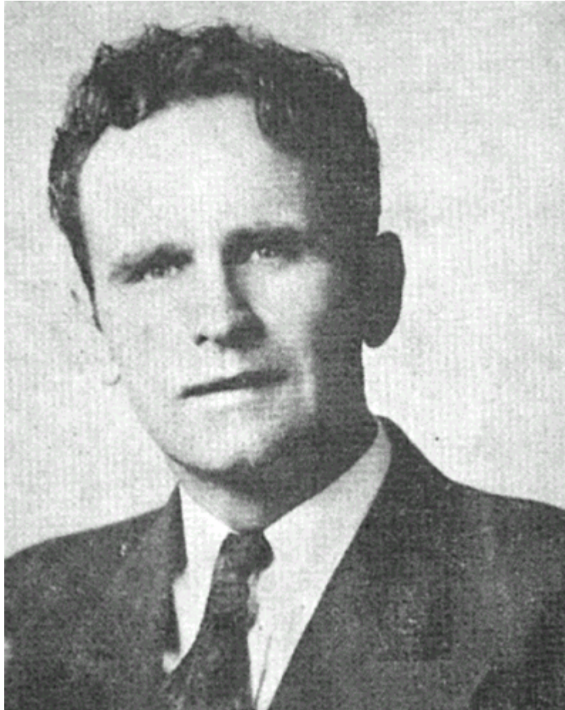
William Branham siendo un joven