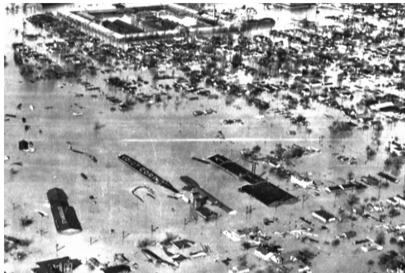
Vista aérea de la inundación en Jeffersonville