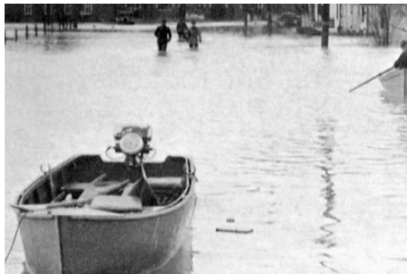
Lancha de motor usada durante las labores de rescate